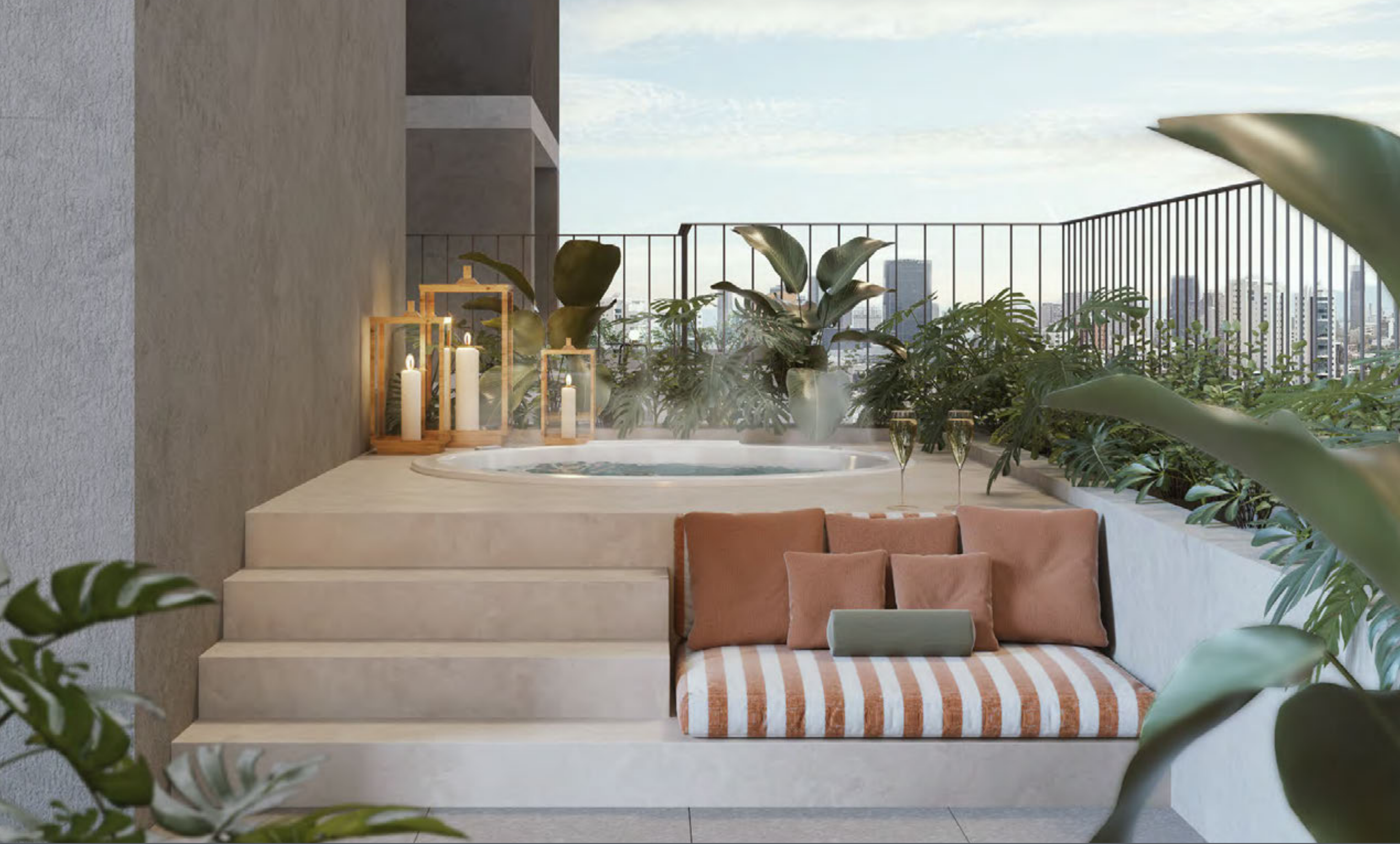
Jacuzzi en terraza