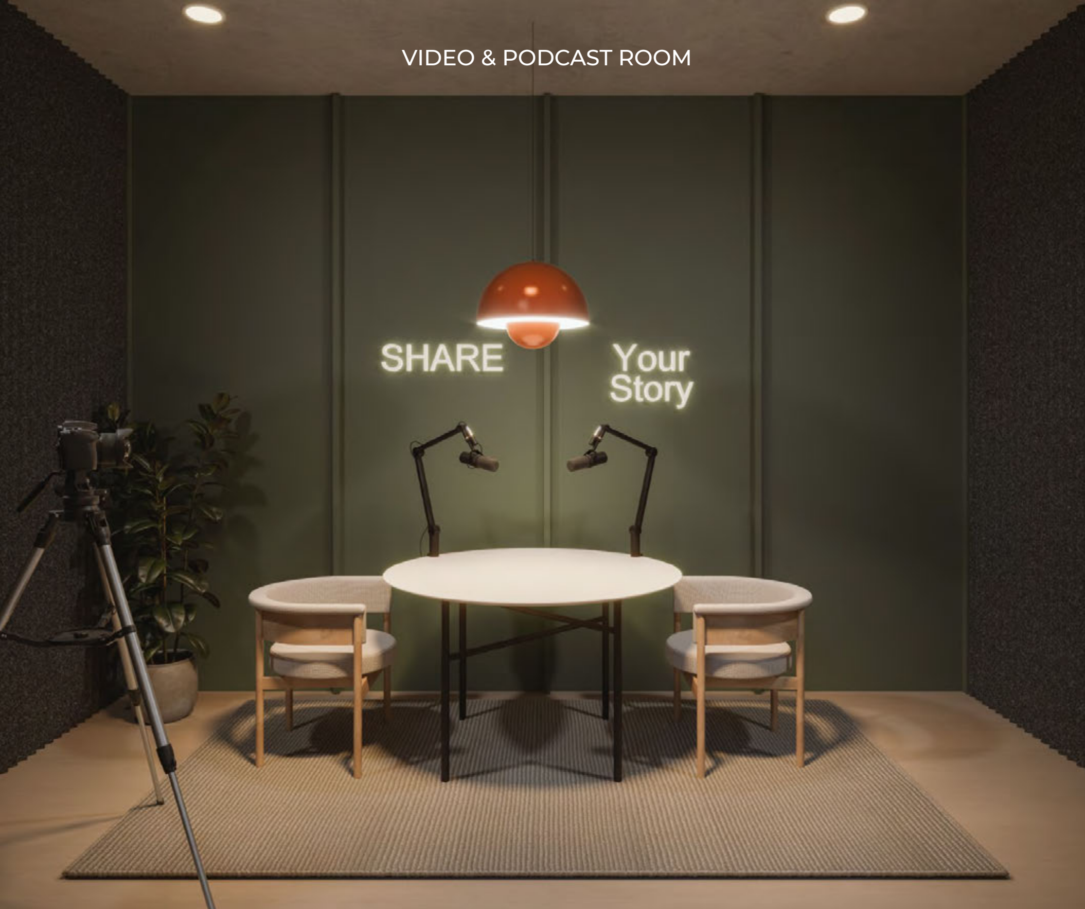
VIDEO & PODCAST ROOM